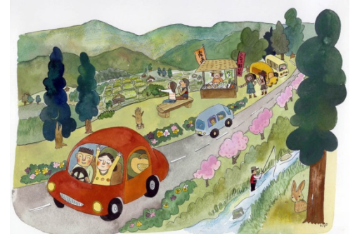
こんな美しい楽しい景観を作ります