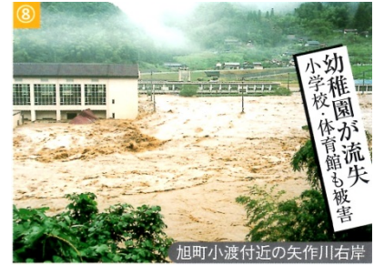
旭町小波付近の矢作川右岸