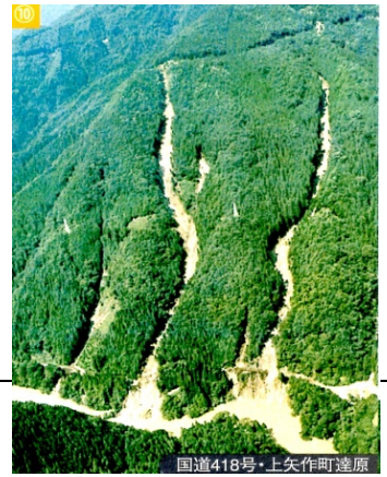
国道418号・上矢作町遠原